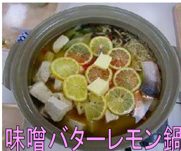
味噌バターレモン鍋